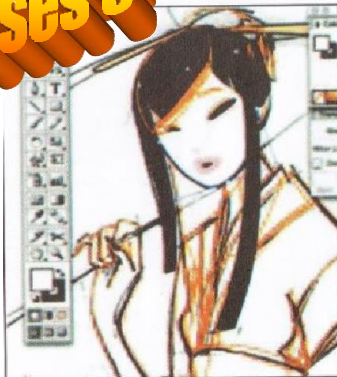
Gambar 5.29 Garis outline dibuat path tertutup kemudian diwarnai dengan fill color.