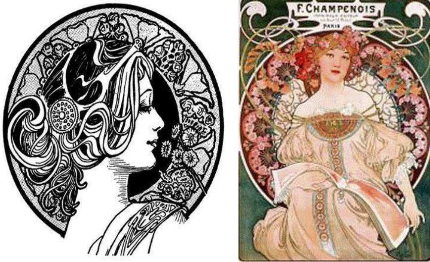
Gambar 5.3. karya-karya lainnya

Art Noveau adalah sebuah gerakan di bidang seni yang dipelopori oleh beberapa seniman Perancis. Art Noveau artinya kurang lebih seni baru. Gerakan seni itu mempersatukan antara Fine Art dan Applied Art atau karya seni yang dipergunakan dalam kehidupan sehari-hari. Sebagai contoh adalah gambar poster yang menginformasikan adanya pertunjukan balet maupun opera yang menampilkan artis-artis terkenal waktu. Berikut contoh Ilustrasi pada era Art Noveau.