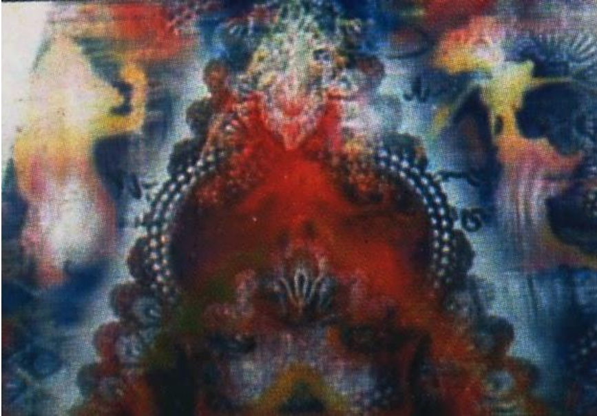
Gambar 5.1. ilustrasi

Sementara teknik fine art lebih diidentikkan dengan fenomena ketika seorang seniman grafis melukiskan ilustrasi dari sebuah cerita atau dongeng. Mereka mencoba merepresentasikan suatu keadaan secara natural sebagaimana orang menggunakan kamera untuk memotret suatu keadaan. Artinya, ilustrasi dibuat dengan teknik yang mendetail agar ilustrasi mendekati pada bentuk atau keadaan yang sebenarnya sehingga identik seperti karya-karya lukis, berikut contohnya