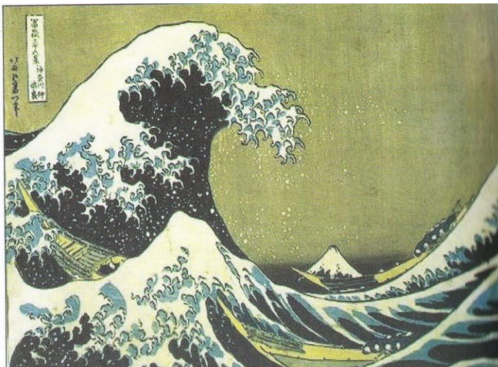
Gambar 5.2. karya-karya lukis