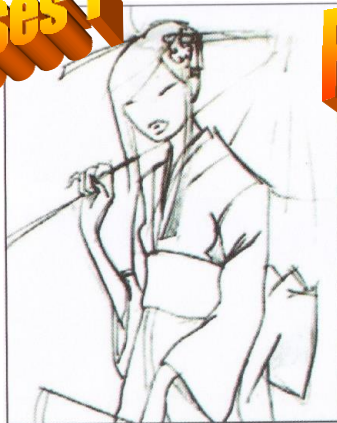
Gambar 5.27 Membuat skets di atas kertas kemudian di-scan dan dibuka di komputer.