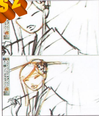
Gambar 5.28 Setelah di-scan skets kemudian digambar dengan menggunakan fill menggunakan warna persis