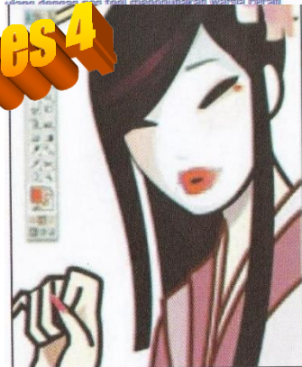
Gambar 5.30 Membuat efek bayangan pada bagian-bagian yang diperlukan.